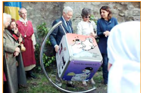
Viterbo ▪ Italia