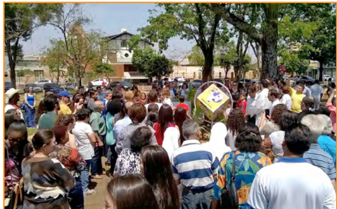
Ibiporã ▪ Brasil