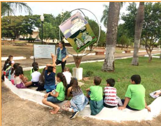
Santa Cruz do Monte Castelo ▪ Brasil