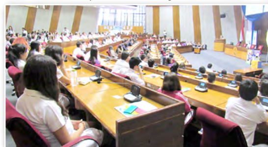
Fórum de la Paz. Paraguay