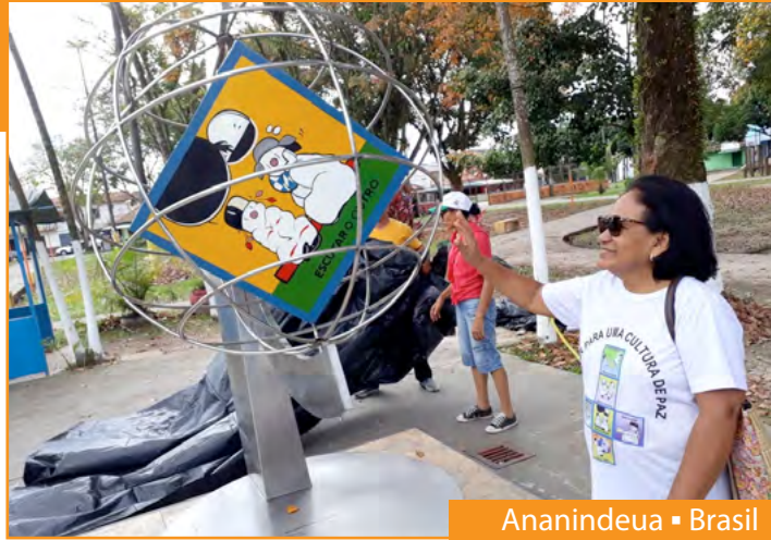
Ananindeua ■ Brasil