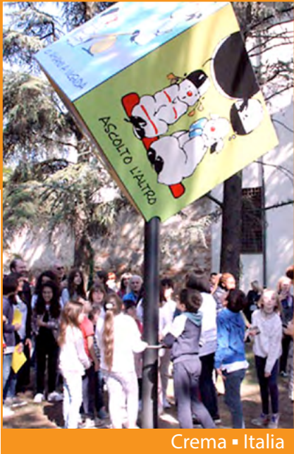
Crema ■ Italia