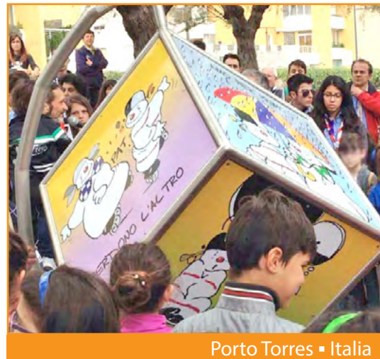
Porto Torres ■ Italia