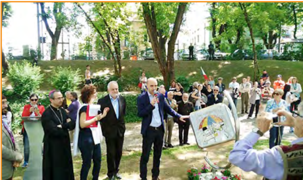
Mantova ▪ Italia