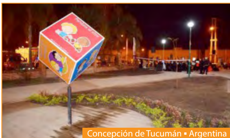
Concepción de Tucumán ▪ Argentina