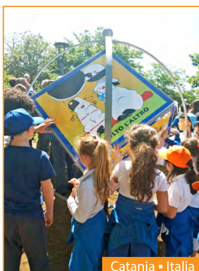
Catania ▪ Italia