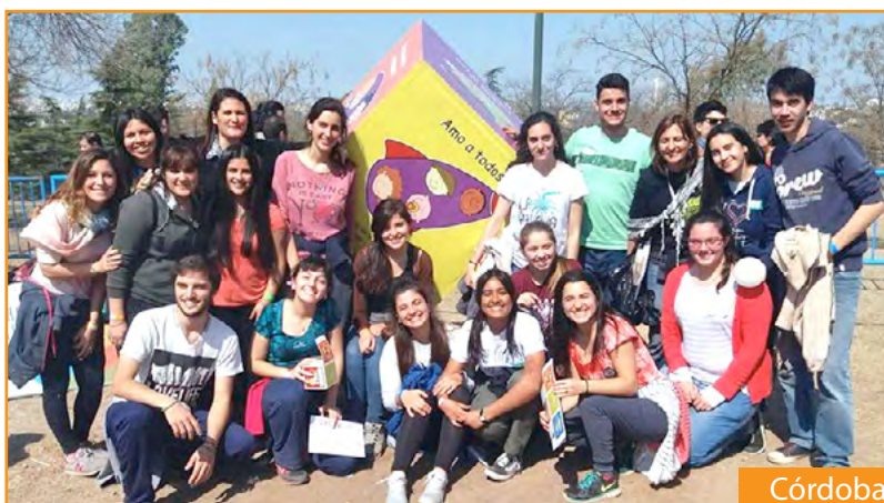
Córdoba ▪ Argentina

He aquí algunas imágenes que los representan.