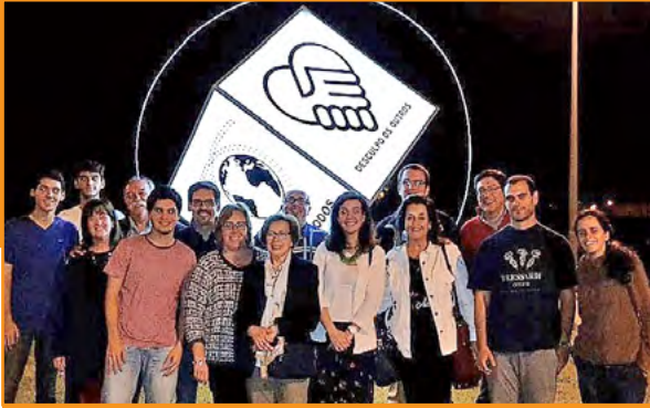
Dado Luminoso. Matosinhos ▪ Portugal