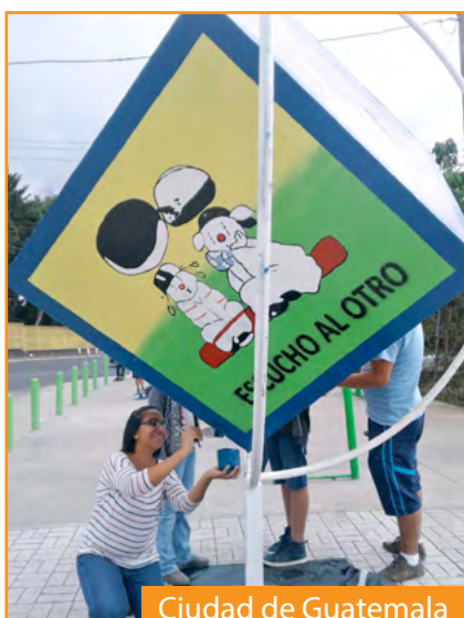
Ciudad de Guatemala