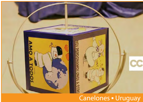
Canelones ■ Uruguay