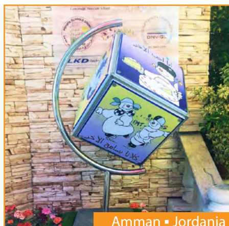
Amman ▪ Jordania