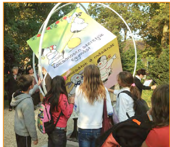
Janoshalma ▪ Hungria