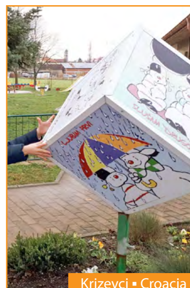
Krizevci ▪ Croacia