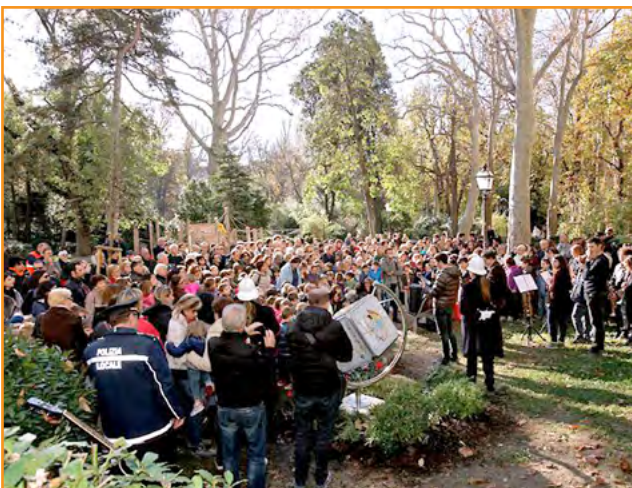
Trieste ▪ Italia